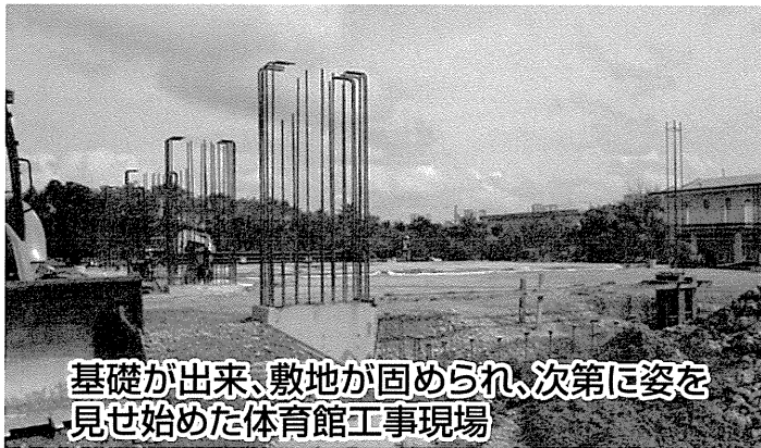
基礎が出来、敷地が固められ、次第に姿を見せ始めた体育館工事現場

新しい年を迎えるに当たり、今一度この点に心を置き、グラム日本人学校の一層の発展を期する次第です。