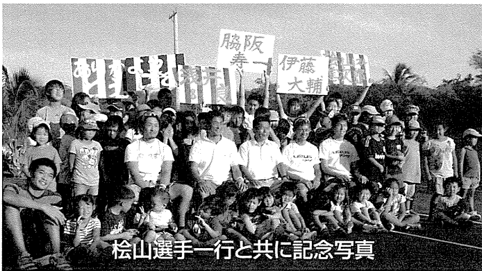
松山選手一行と共に記念写真